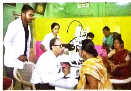
Health Camp at Dhubri

Swasth SHG Pariwar initiative was carried out on all ULBs with the objective of linking all eligible SHG members of DAY-NULM with Ayushman Bharat-Pradhan Mantri Jan Arogya Yojana and POSHAN scheme, besides organizing health check-up camps for all SHG members by 2nd October, 2019. The key initiatives were