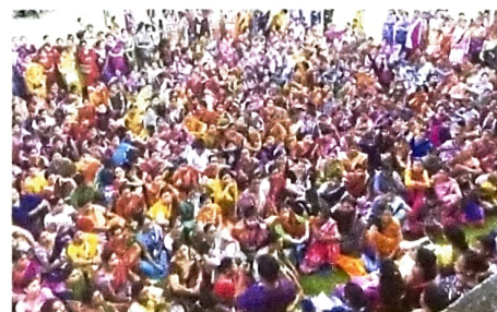
Awareness meet at Hojai